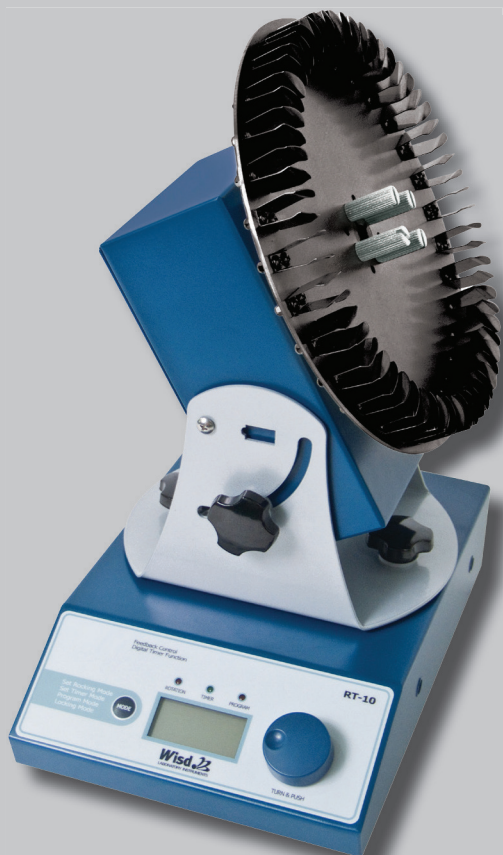
RT-10 mit Scheibe WRT120